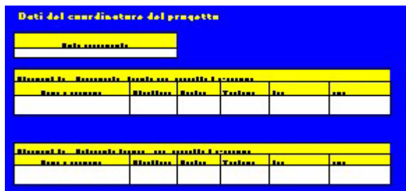
Figura 3. Coordinatore

Nel foglio COORDINATORE devono essere inserite le informazioni di sintesi sull'ente proponente il progetto , nonché coordinatore del progetto stesso.