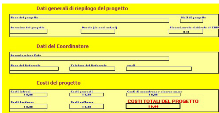
Figura 4. Riepilogo

Il foglio RIEPILOGO non deve essere compilato e riporta alcuni dei dati inseriti nei fogli precedenti.